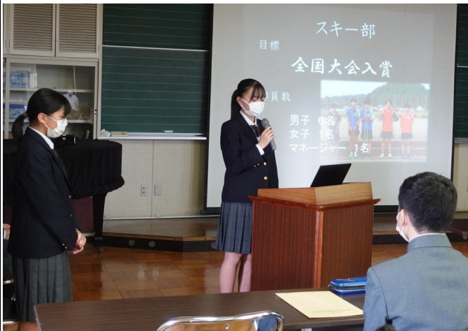
生徒会役員による部活動紹介

22名の中学生と、多くの保護者の皆さんが参加してくれました。理科の体験授業では、ケチャップやソース、研磨剤を使って10円玉を磨く実験を行いました。また生徒会役員による部活動紹介と、生徒会執行部とのグループ懇談により、金山校の学習や生活についての理解を深めてもらいました。(10/4)