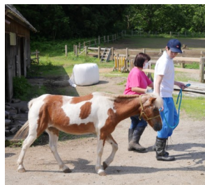
セラピーファーム体験