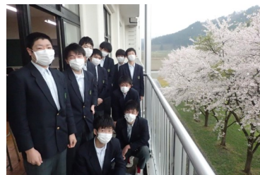
三階のペランダで、満開の桜を背景に3年次生

例年7月に実施しておりました、2年次生のインターンシップは、9月1日からの4日間、多くの企業や公署の皆様のご協力をいただき実施いたします。実施に当たり、ご配慮いただくことやお願いすることが多々ございますが、なにとぞ、よろしく願い申しあげます。有意義な体験としてまいります。