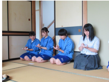
総合文化部(茶華道班)