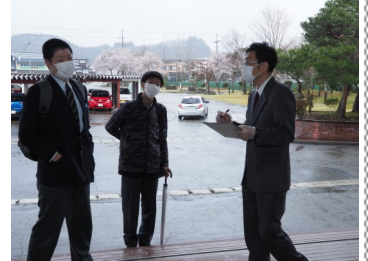
久しぶりの登校(4月22日)