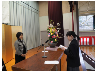
4月22日 入学式での代表生徒宣誓

経験したことのない、コロナ禍の中で新年度を迎え、例年よりも2週間短い夏休みを迎えようとしております。19名の1年次生を迎え、55名の全校生徒での、4カ月間の学校生活の様子をお知らせいたします。