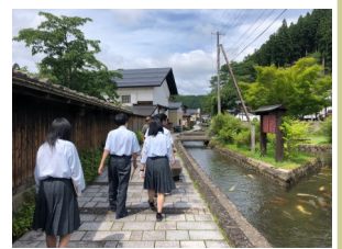
日本文化（地域探究）