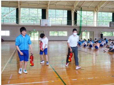
防災訓練では、全校で体育館に避難

夏季休業は、8月4日（火）から、8月18日（火）までの約2週間と、短い期間となりましたが、各年次の目標達成に向け、頑張っていけます。