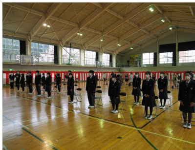
年次団と、1年次生19名

生徒総会は、全校生徒が一堂に集まらず、各教室での分散の形式で行いました。また、晴れた日には、英語の授業の中で、互いに会話をする場を、昇降口前で行うなど、工夫しながら学校生活を行っています。