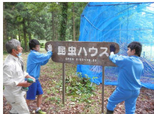
自然、昆虫、魚の観察