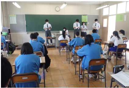
生徒会役員が、各教室で議案書説明

生徒総会は、全校生徒が一堂に集まらず、各教室での分散の形式で行いました。また、晴れた日には、英語の授業の中で、互いに会話をする場を、昇降口前で行うなど、工夫しながら学校生活を行っています。